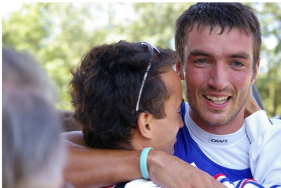
Un grand champion qui en félicite un autre... C'est beau !

Je crois que tu es un grand féru de golf... Tu peux nous parler un peu de cette passion ? D'où te vient-elle ? Et qu'est ce que tu trouves dans la pratique de ce sport ? "J'ai commencé le golf il y a une dizaine d'années. Ma maman pratiquait cette activité et c'était une bonne occasion pour passer plus de temps avec elle. Quand tu es sportif de haut niveau, tu n'as pas beaucoup de temps, alors autant joindre l'utile à l'agréable. Au fil des années, j'ai un peu augmenté mon niveau mais les compétitions individuelles ne m'intéressent pas. J'aime jouer en équipe ou aller sur des compétitions avec d'anciens sportifs comme les verts de 76 et partager avec eux de beaux moments d'échange et de partage..."