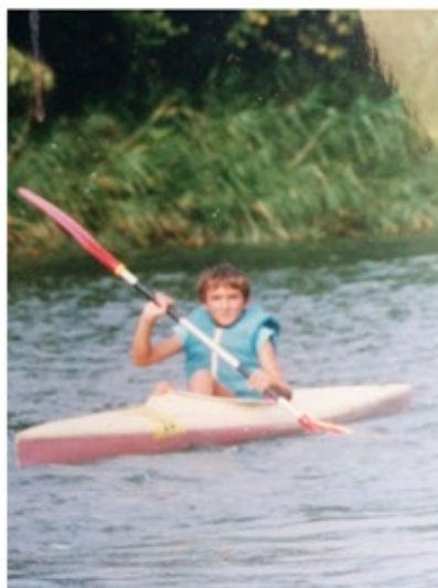
Philippe au départ des JO de Pékin... #lejournalistecraquesonslip

Tu peux nous parler de tes débuts en canoë-kayak ? Et qu'est ce qui t'a plu dans cette activité ? J'ai débuté le kayak en 1986 au club de Marnay (70). Ma maman cherchait une activité pour que nous puissions, ma sœur et moi, nous dépenser. Le kayak semblait pouvoir faire l'affaire. Malheureusement pour elle, dès la première séance il a fallu qu'elle insiste pour qu'on sorte de l'eau, au bout d'environ 3h.